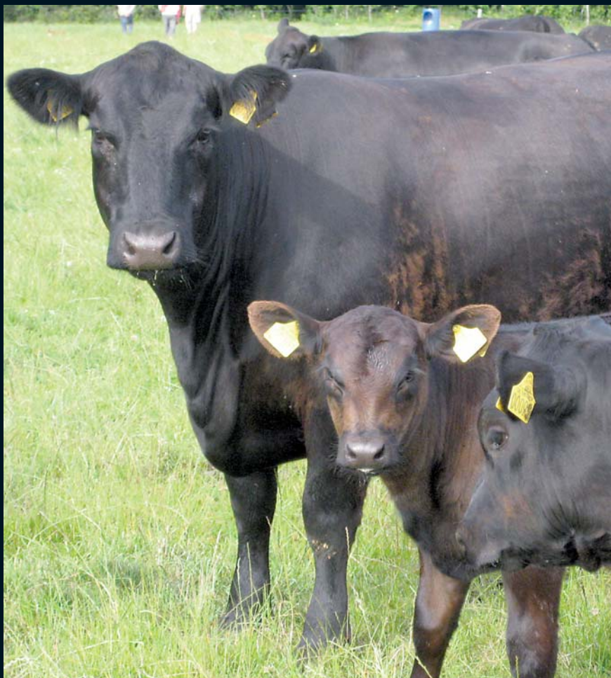
Angus græsser de fredede arealer ved Vorgod å

er ANGUS det naturlige valg, når man skal vælge dyr til at afgræsse naturplejearealer.