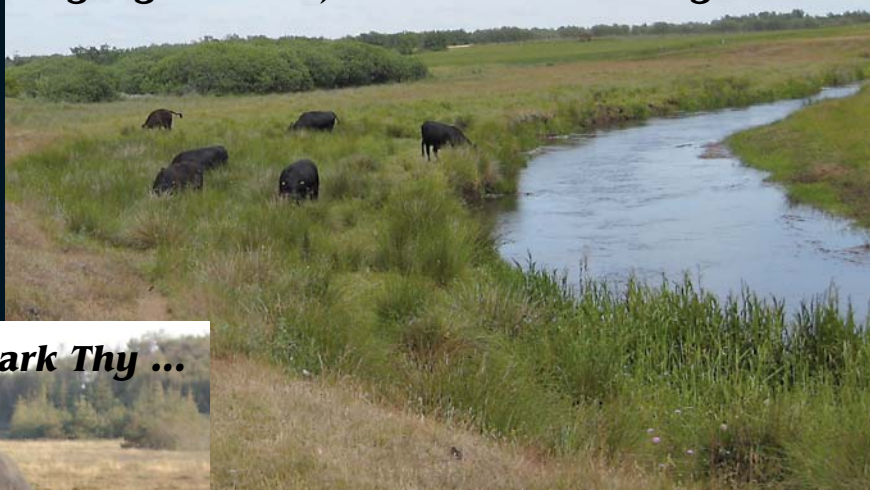
Angus græsser Nationalpark Thy ...